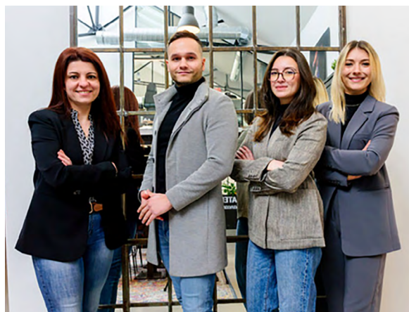
L'équipe de Level Hop

Le CDI Performance est l'une de ces solutions innovantes. Sa spécificité est d'offrir à des salariés déjà en CDI une formation diplômante d'un niveau CAP à BAC+3 tout en bénéficiant d'avantages financiers notables pendant toute la durée du cursus, de 1 à 3 ans.